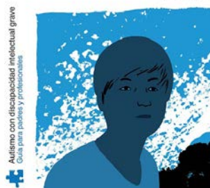
NOVEDAD. Rita Jordan

Rita Jordan Autismo con discapacidad intelectual grave Guía para padres y profesionales